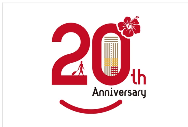
開業20周年記念ロゴ

キャッチフレーズに掲げる「笑顔＝スマイル」と「20」を組み合わせたロゴは、ホテル正面玄関にある紅型ファサードから着想を得たハイビスカスの花をあしらい、沖縄らしさを表現しています。また、「0」の中に配したホテルの外観と、そこへ歩みを進めるお客様の姿には、これまでの歩みへの感謝とともに、これから先も多くの笑顔をお迎えしていきたいという思いを込めました。